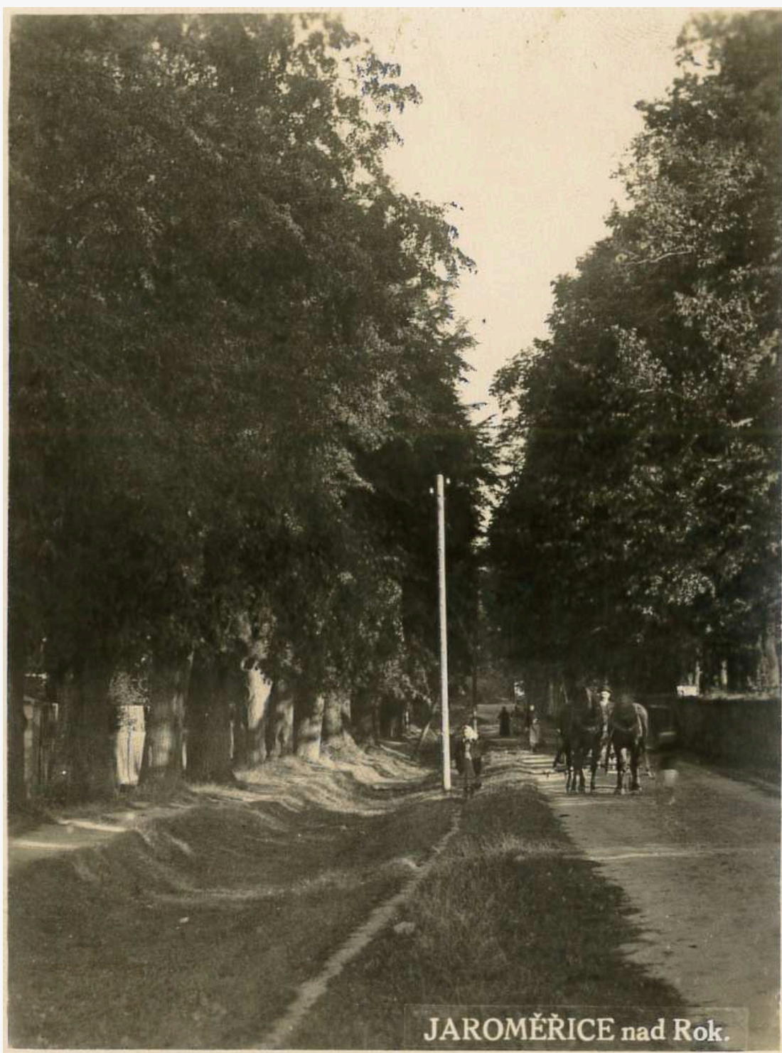
JAROMĚŘICE nad Rok.

Frambiz se nazývá spojovací krátká silnice, původně lemovaná alejí, a celý prostor mezi hlavními silnicemi Moravské Budějovice – Třebíč a Jaroměřice nad Rokytnou – nádraží. Na tomto místě bývala dříve louka, která náležela paním. Název Frambiz je tak prý složen ze slov Frauen a Wiese. V 70. letech 20. století začala u Frambizu výstavba nových domů. Toto místo získalo nové lidové označení Komárov. Na konci Frambizu, v místech u řeky Rokytné, bývaly kdysi panské sádky, proto se všem zahradám, které zde později bývaly, říkalo V Sádkách.