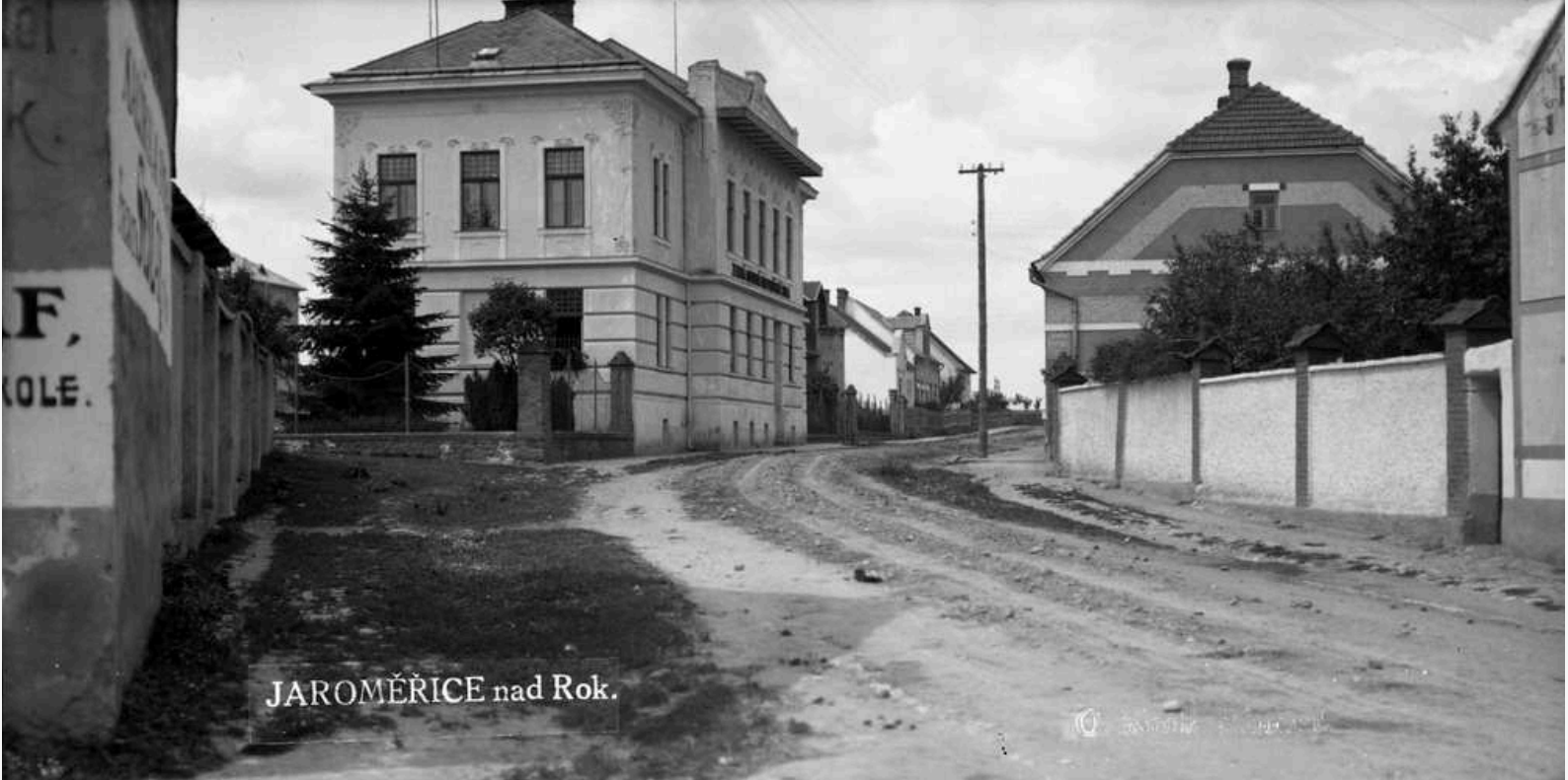
JAROMĚŘICE nad Rok.