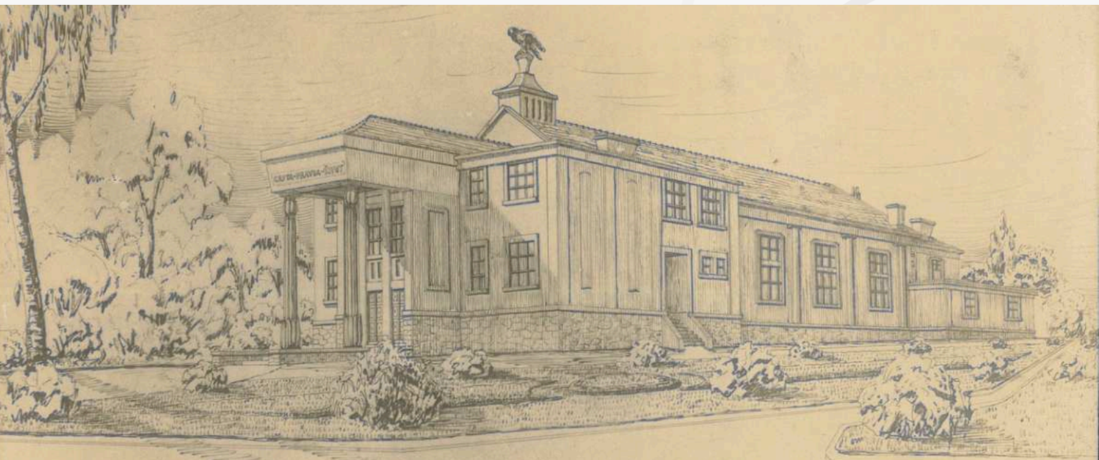
I - PERSPEKTIVNÍ POHLED TĚLOCVIČNY „SOKOLA“ v JAROMĚŘICÍCH - I

Do roku 1925 využívali jaroměřičtí sokolové pro své aktivity tělocvičnu ve školní budově postavené roku 1899. Vlastní budovy se dočkali po první světové válce. Díky darům, sbírkám a také půjčkám se podařilo budovu sokolovny postavit a v lednu 1925 slavnostně otevřít. Otevření sokolovny se zúčastnil i básník Otakar Březina, který na stavbu budovy finančně přispěl. V průběhu stavby se sokolům podařilo získat licenci na provozování kinematografu, z nové budovy se tedy stal také biograf. Budova byla částečně užívána až do roku 2013, kdy ji nechala sokolská župa uzavřít. V roce 2016 byl zdevastovaný areál odkoupen městem a v roce 2017 byla budova zbourána.